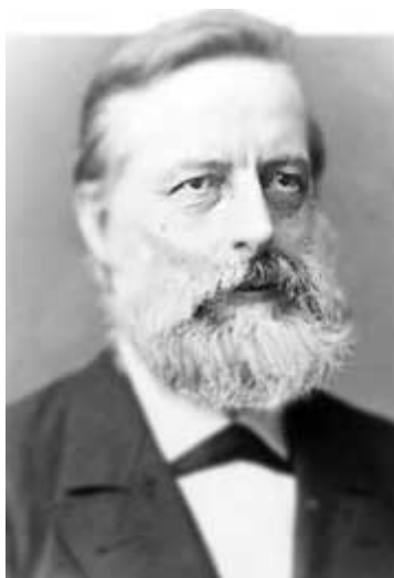
Fig. 1. Julius Lothar Meyer.